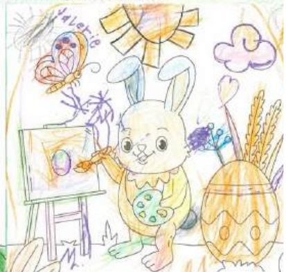
Einsendung von Valerie Ruthner