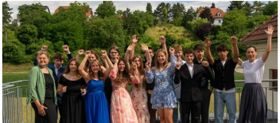
Wir wünschen den Absolventinnen und Absolventen der Klasse 4a alles Gute für ihre Zukunft.