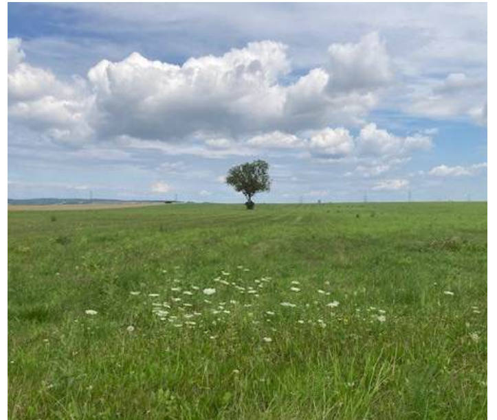
Früher Abend am Brunenberg, Goldgeben Richtung Zissersdorf.