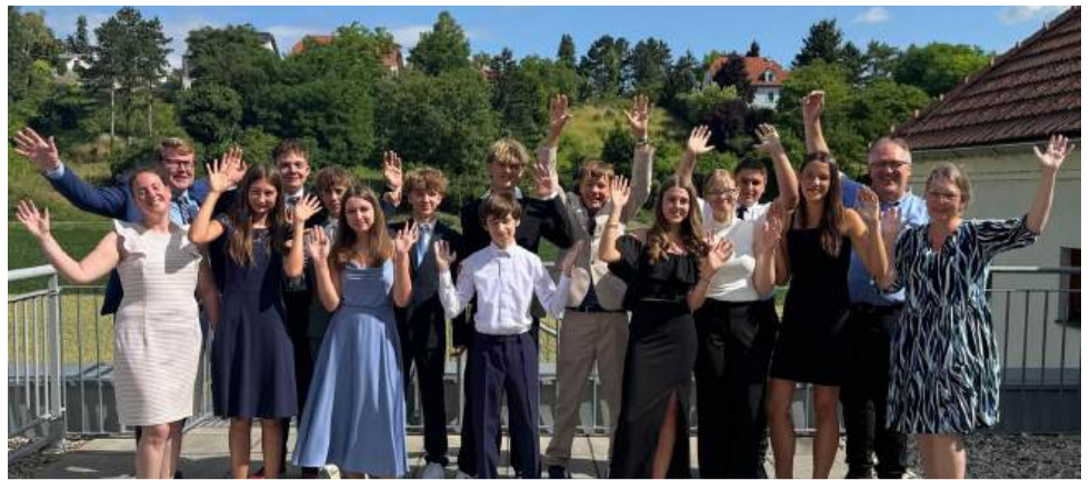
Wir wünschen den Absolventinnen und Absolventen der Klasse 4b alles Gute für ihre Zukunft.