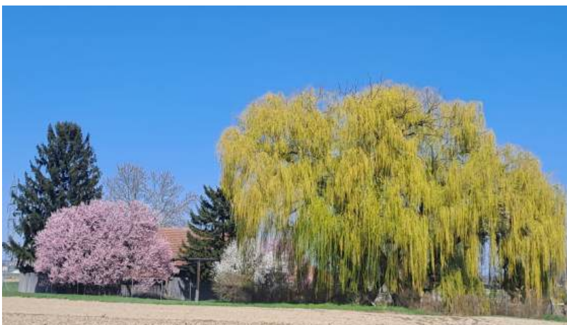
Teich | Zaina