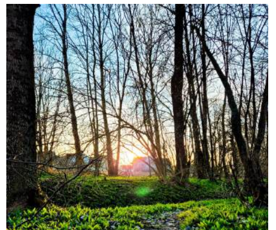
Bärlauch | Marienbründl Hausleiten