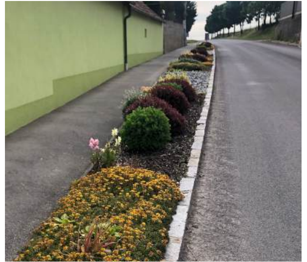
Liebevoll gestaltete Insel | S.-W.