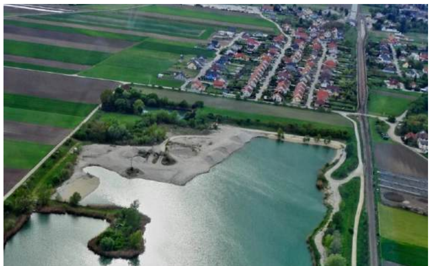
Luftbildaufnahme vom Dorffest 2016 | Goldgeben und Hausleiten