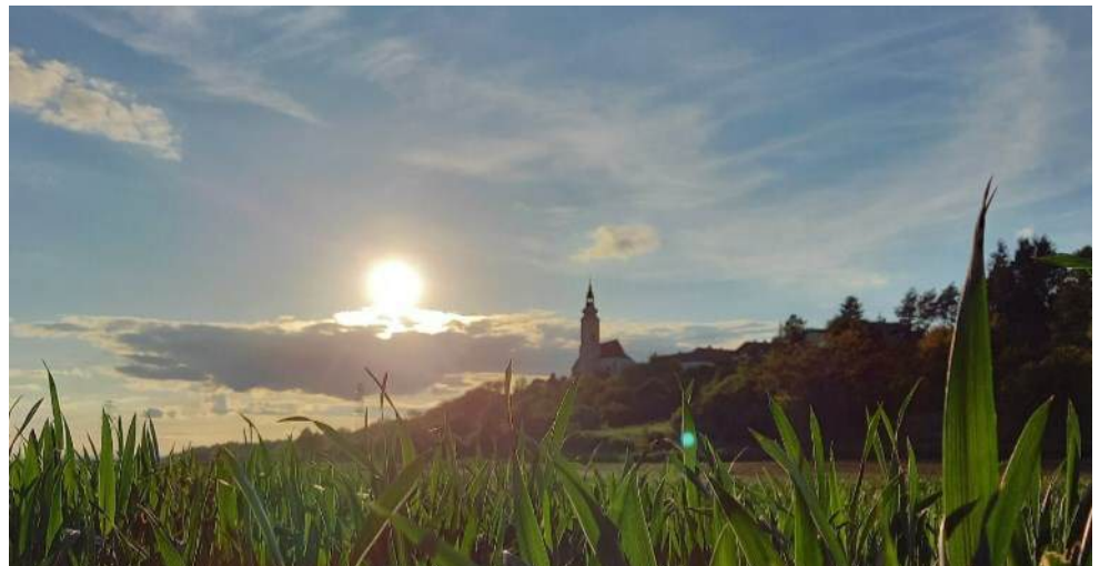
Liebings-PIC aus der Herzensheimat | Hausleiten