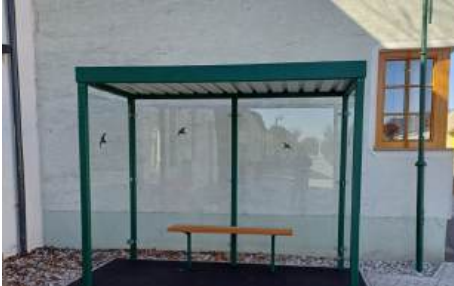
Neue Bushaltestelle in Schmidau

Weitere Adaptionen und Verbesserungen sind bereits in Planung, um den öffentlichen Verkehr für alle noch attraktiver und zugänglicher zu gestalten. Parallel dazu befinden sich derzeit weitere Infrastrukturmaßnahmen in Vergabe , die in den kommenden Monaten sichtbar und spürbar umgesetzt werden.