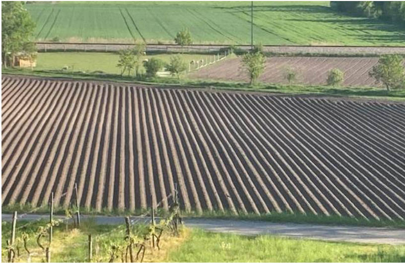
Die Erdäpfel sind gelegt! | Goldgeben