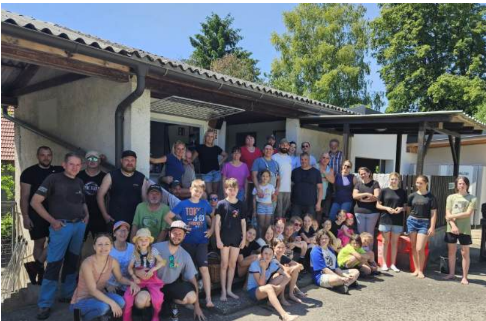
Fleißige Helfer:innen beim Frühjahrsputz im Bad Gaisruck – danke für euren Einsatz!

Ein sportlicher Meilenstein wurde durch den Tennisverein gesetzt, der mit viel Engagement und Unterstützung den neuen Padeltennisplatz realisieren konnte. Dieses moderne Freizeitangebot erfreut sich bereits großer Beliebtheit – eine großartige Ergänzung zu unserem sportlichen Angebot in der Gemeinde und ein Beispiel dafür, was durch gemeinschaftliches Engagement möglich ist.