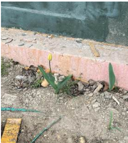
Der Frühling ist überall Dorfhaus Goldgeben