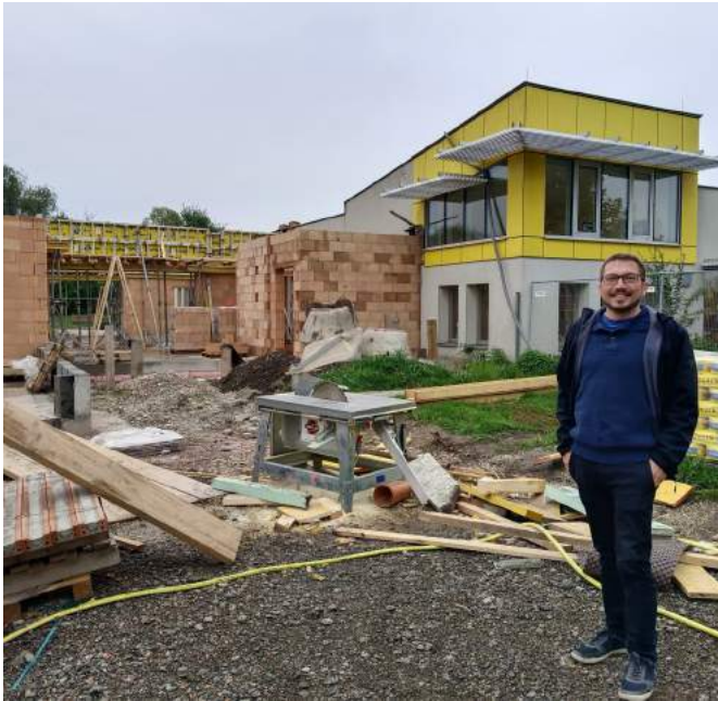
Bürgermeister Andreas Neubauer machte sich persönlich ein Bild vom Ausbau des Kindergartens.