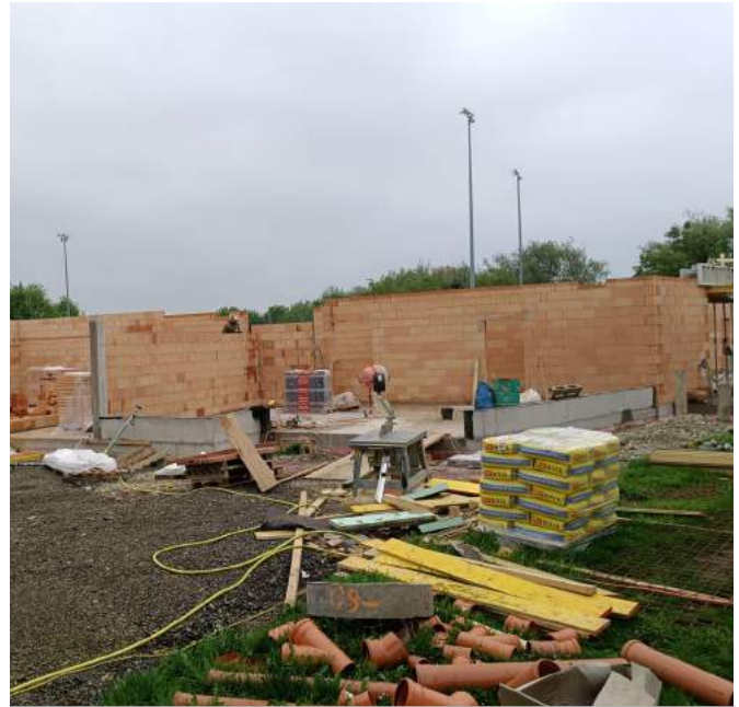
Mit dem Aufmauern der tragenden Wände wurde einer der ersten Meilensteine am Bau geschafft.